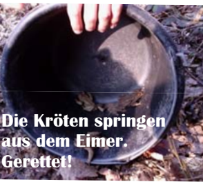
Die Kröten springen aus dem Eimer. Gerettet!