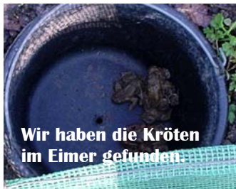
Wir haben die Kröten im Eimer gefunden.