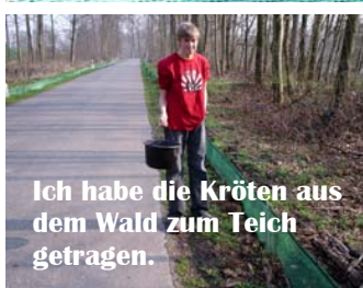
Ich habe die Kröten aus dem Wald zum Teich getragen.