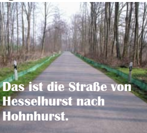
Das ist die Straße von Hesselhurst nach Hohnurst.